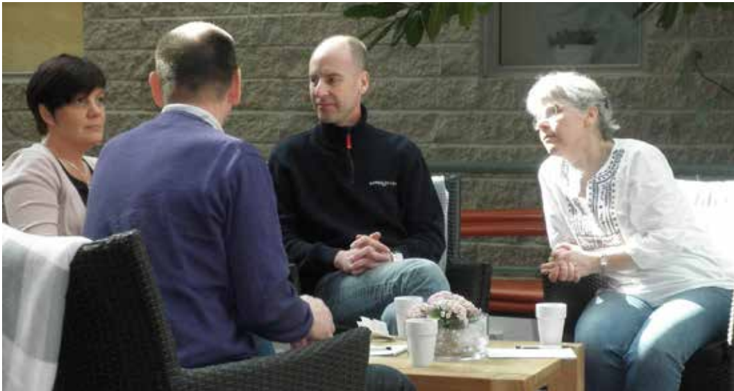
Samtalet är i fokus under familjehelgen på Kurorten Mösseberg, som erbjuds av Gislaveds kommun i samarbete med Bräcke diakoni.